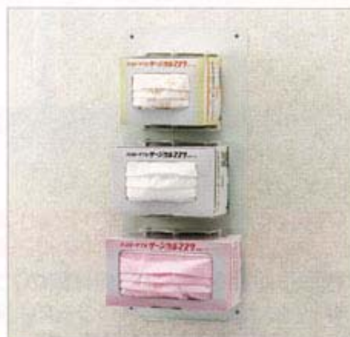
● ハイジエニックハンガー(手前)・ボード

※ハイジエニックハンガーとボードは別売です。 ※ハイジエニックハンガーは1セット2個入りです。