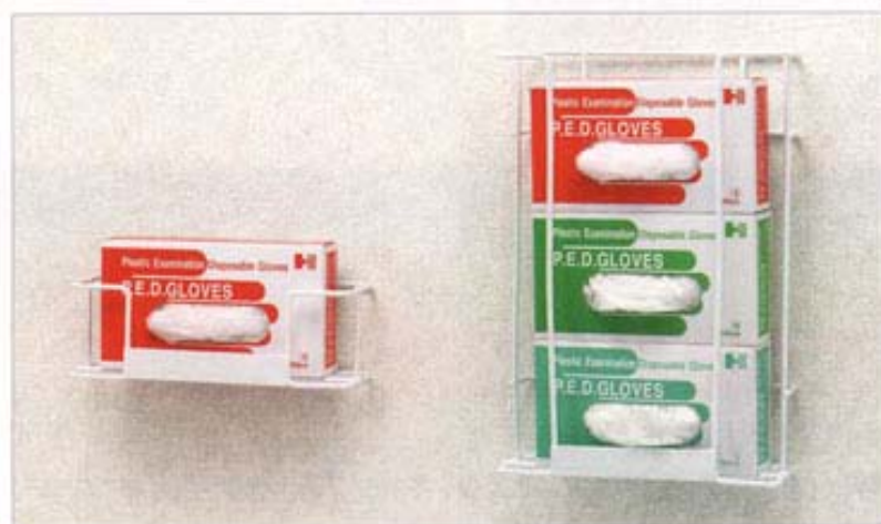
● グローブホルダー 1連(左)3連(右)