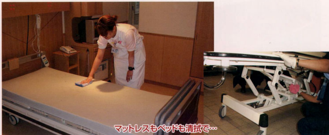
マットレスもベッドも清拭で...